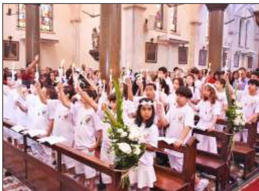
JERUSANEJA - dia 6

Primeira Eucaristia Infantil e Adolescentes - dia 6