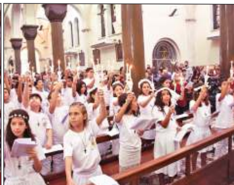
Dia de N. Srª de Fátima - dia 13