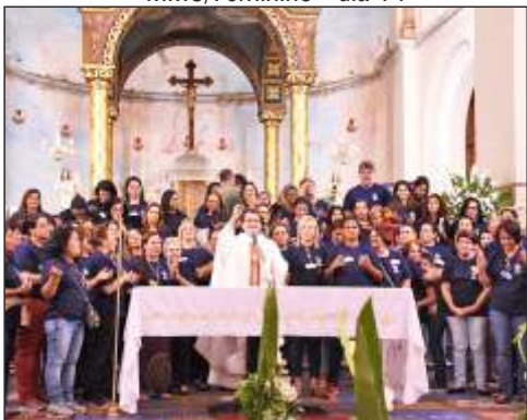
INTERPAROQUIAL - de 19 a 21