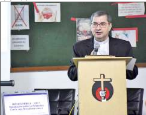
Coroação de N. Srª de Fátima - dia 28